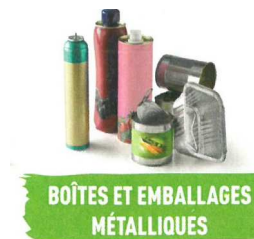
BOÎTES ET EMBALLAGES MÉTALLIQUES

Pas besoin d'enlever les bouchons des bouteilles