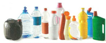
BOUTELLES ET FLACONNAGES EN PLASTIQUE