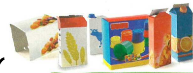
BRIQUES ALIMENTAIRES ET EMBALLAGES EN CARTON